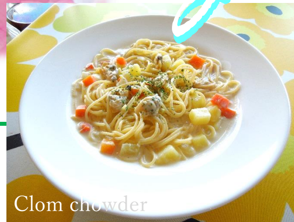
Clom chowder あさりのクラムチャウダースパ ¥950 サラダ+ドリンクバー付き

春の産卵を控えたあさりには、 身が肥えてとても美味しい時期です。 貧血予防や疲労回復に頼もしい食材です。