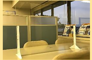
透明アクリル板のつい立て