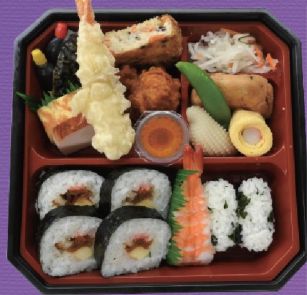
5 1,500円 税込