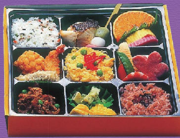
6 1,800円 税込