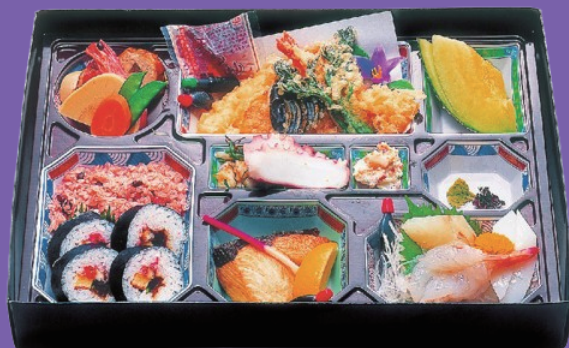
16 4,500円 税別