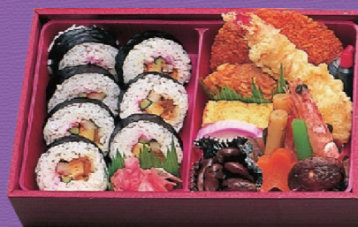
12 1,600円 税込