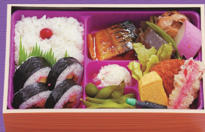
11 1,200円 税込