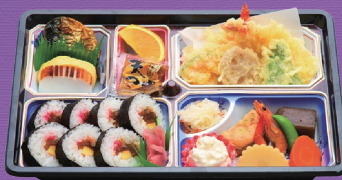
9 1,800円 税込