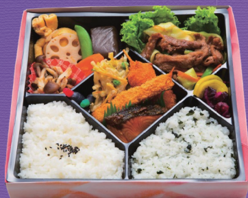
4 1,400円 税込