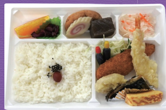
3 1,000円 税込