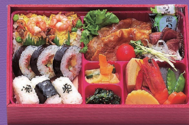
13 1,800円 税込