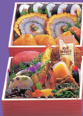
14 3,300円 税別