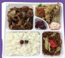
1 1,000円 税込

美味しくてバラエティに富んだお弁当メニューをご用意しました。 素敵なランチ・ブレイクをお過ごしください。