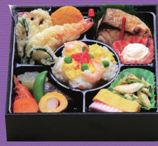
7 1,800円 税込