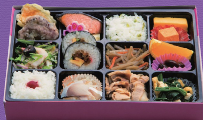
8 1,500円 税込