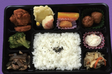
2 1,000円 税込