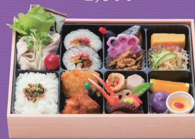
10 2,700円 税込